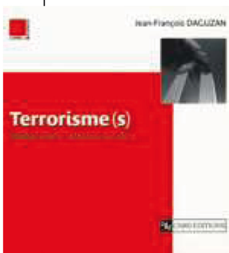
Terrorisme(s), abrégé d'une violence qui dure Jean-François Daguzan CNRS Editions 128 pages 12 euros